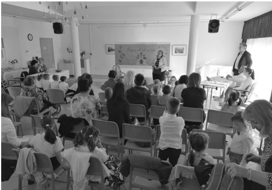
"Egyszer volt, hol nem volt..."

Április 12-én, pénteken a Magyar Költészet Napjához kapcsolódóan a Bertha Bulcsu Művelődési Ház és Könyvtár adott otthont a balatongyöröki tagóvoda által hagyományteremtő szándékkal szervezett mese-mondó délelőttnek. A balatongyöröki óvodások mellett a vonyarci, karmacsi, rezi, csereszegtomaji és zala-szántói óvodákból is szép számmal érkeztek kisgyerekek, akik nehéz feladat elé állították a zsűritagokat, hiszen nagyon ügyes volt minden résztvevő. A 31 kisgyerekeknek egy-egy mesét vagy verset kellett előadnia, így a déli eredményhirdetésre kicsit már kifáradva, de jókedvűen vehették át megérdemelt jutalmukat a gyerekek.