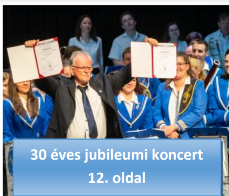
30 éves jubileumi koncert 12. oldal