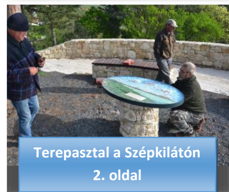
Terepasztal a Szépkilátón 2. oldal