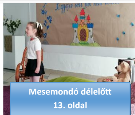
Mesemondó délelőtt 13. oldal