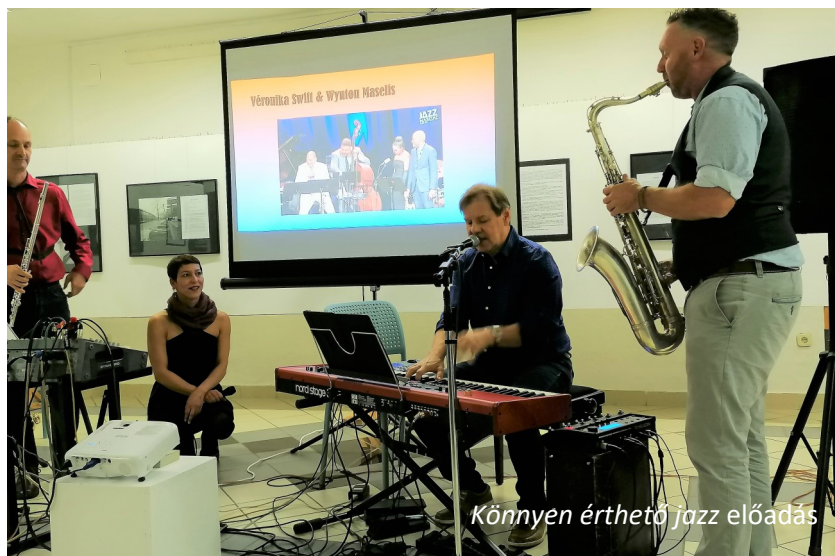
Könnyen érthető jazz előadás