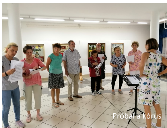
Próbál a kórus