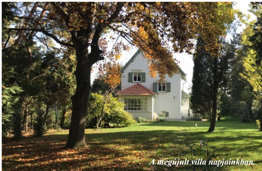
A megújult villa napjainkban.

Az 1920-as évek vége felé a györöki "villasor", a mai Petőfi Sándor utca, még gyakorlatilag beépítetlen volt. Három, talán négy ház állott a soron, de fából is alig volt több az üres, kopasz területen, ami a vasút építése során jött létre.