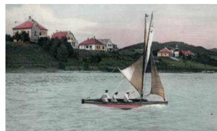
Házak a villasorról 17. oldal