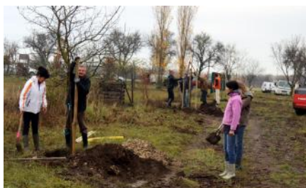
10 millió fa 16. oldal