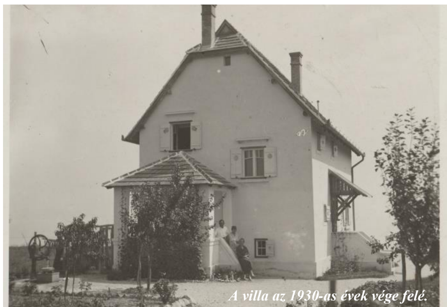
A villa az 1930-as évek vége felé.

Köszönet Polster Tamásnak a cikk megírásáért! A ház 2019-ben elnyerte az „Épített örökség megóvásáért” oklevelet a Virágos Balatonyörökért mozgalomban. (szerk.)