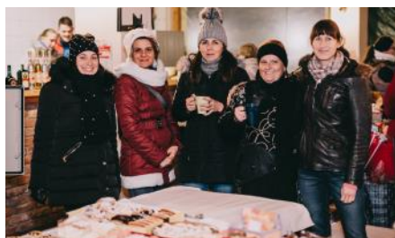
Adventi Forгатag 2. oldal